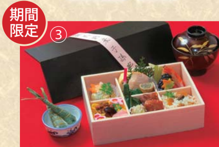
京折詰 大船 2400円