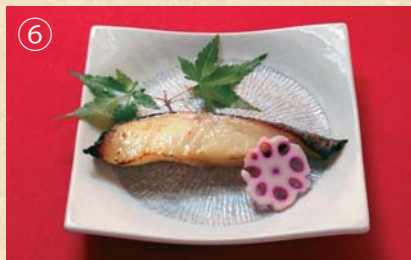
銀だら西京焼定食 1700円

※魚の定食にはご飯、味噌汁、小鉢が付きます Set meal includes rice, miso soup and side dish